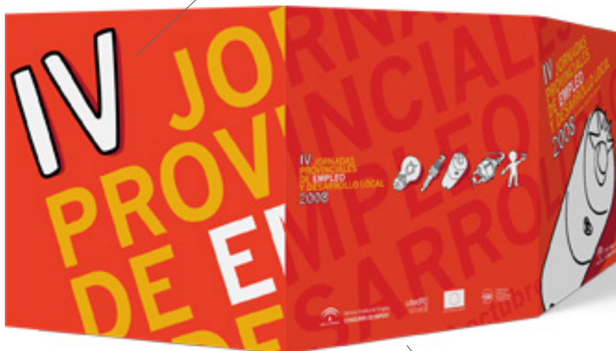
Contraportada con los cinco motivos principales