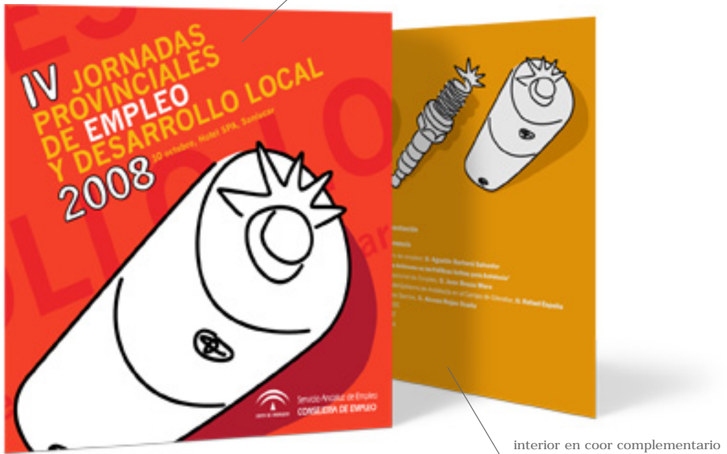
interior en color complementario